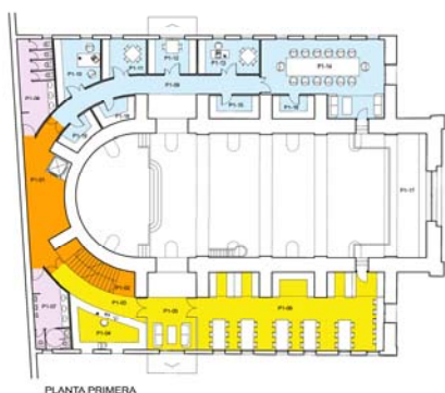
PLANTA DE ALTERNATIVAS DE USO