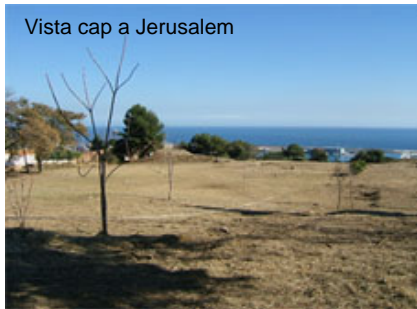
Vista cap a Jerusalem

Dins la tradició jueva, el respecte cap als difunts inclou la prohibició absoluta d'exhumar els cossos, fins i tot segles després de l'enterrament. Aquest fet explica la preocupació que trobem, al món jueu local i internacional, davant l'excavació i l'obertura de tombes al cementiri de Montjuïc. Després de la incoació de l'expedient de declaració de BCIN, també es va sol·licitar informació sobre el destí dels restes excavats per tal de poder donar-les-hi sepultura novament.